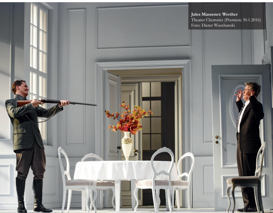
Jules Massenet: Werther Theater Chemnitz (Premiere 30.1.2016)

Werther ist ein von Jules Massenet und seinem Librettisten geschickt konstruiertes Drama nach dem Briefroman des Dichterfürsten Goethe. Im Mittelpunkt steht hier Charlotte als Objekt der Verehrung