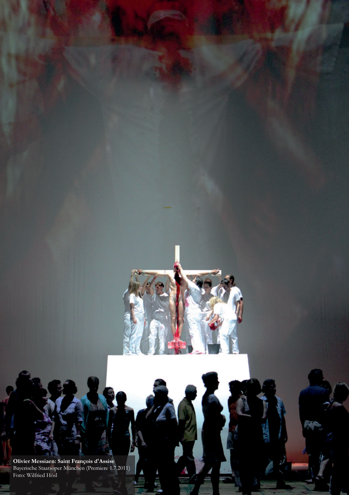
Olivier Messiaen: Saint François d'Assise Bayerische Staatsoper München (Premiere 1.7.2011)