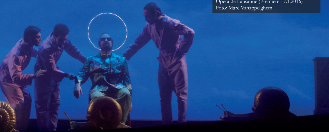
Francis Poulenc: Les Mamelles de Tirésias Opéra de Lausanne (Première 17.1.2016)